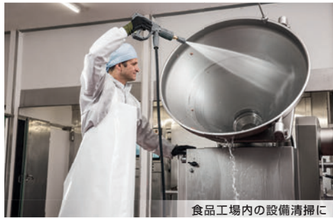
食品工場内の設備清掃に