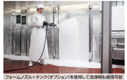
フォームノズル+タンク(オプション)を使用して洗浄剤も使用可能