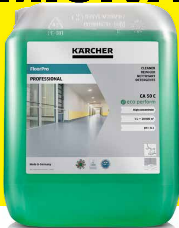
FloorPro Cleaner CA 50 C eco!perform