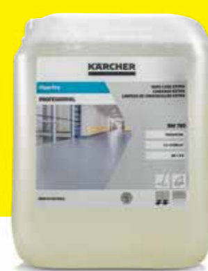
FloorPro Wipe Care Extra RM 780