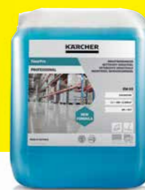
FloorPro Industrial Cleaner RM 69

Kärcher suosittelee KIRA B 50 -siivous-robotille käyttökohteen, lattiamateriaalin ja likaisuusasteen mukaan räätälöityjä pesuaineita, jotka kaikki ovat koneitamme ajatellen suunniteltuja, turvallisia käyttää ja ympäristön huomioivia.