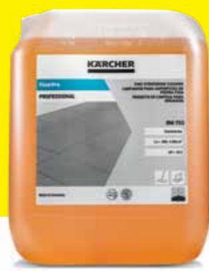
FloorPro Fine Stoneware Cleaner RM 753