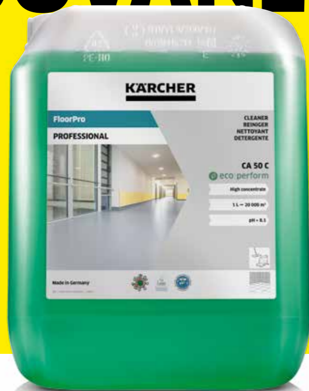
FloorPro Cleaner CA 50 C eco!perform