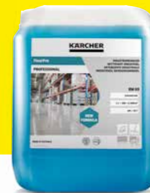
FloorPro Industrial Cleaner RM 69

Beroende på plats, golvbeläggning och hur smutsigt det är rekommenderar Kärcher olika rengöringsmedel till städroboten KIRA B 50. Alla är naturligtvis både säkra, miljövänliga och perfekt anpassade till maskinen.