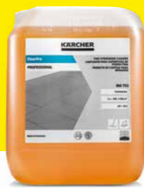
FloorPro Fine Stoneware Cleaner RM 753