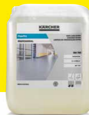
FloorPro Wipe Care Extra RM 780