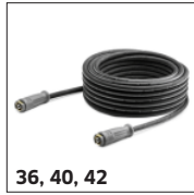
36, 40, 42