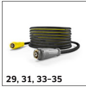
29, 31, 33-35