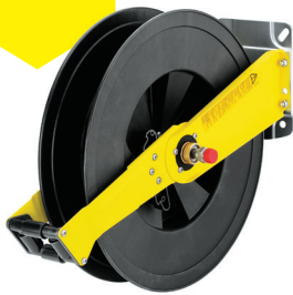
Hochdruckschlauchtrommel mit 20 m Hochdruckschlauch und Verbindungsschlauch