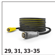
29, 31, 33-35