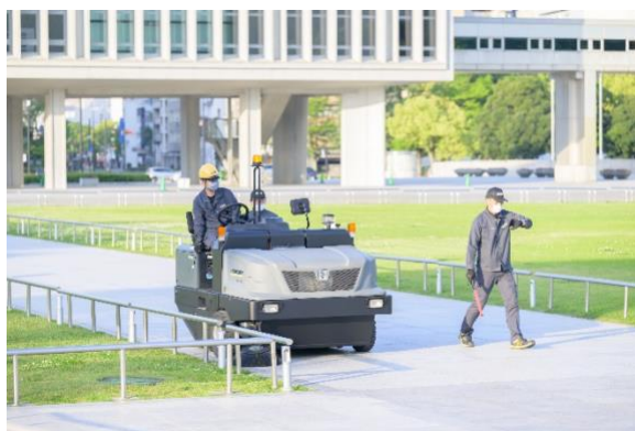
インダストリアルスーパーで広面積を短時間で効率的に清掃