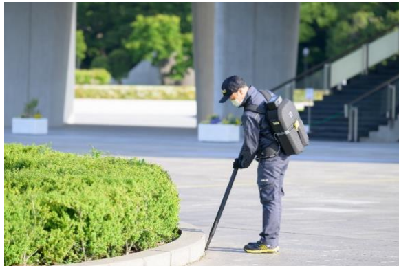
コードレス背負式クリーナーで細かい部分のごみ取り