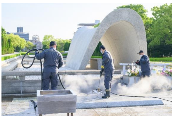
温水高圧洗浄機で目地に入り込んだコケや砂など除去