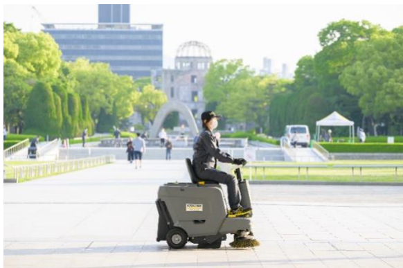
搭乗式バキュームスイーパーにより路面の小石や砂塵・粉塵等を回収