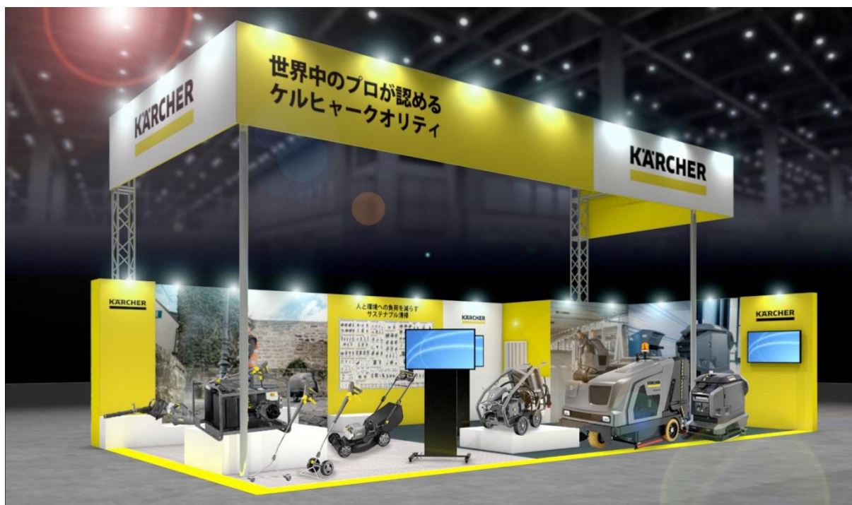
CSPI-EXPO 2023 ケルヒヤーブースイメージ

清掃機器の最大手メーカー、ドイツ・ケルヒヤー社の日本法人、ケルヒヤー ジャパン株式会社（本社：神奈川県横浜市港北区、代表取締役社長：マーク・ヴァン・インゲルゲム）は5月24日（水）～26日（金）に幕張メッセにて開催される「第5回 建設・測量生産性向上展（CSPI-Expo 2023）」に初出展します。