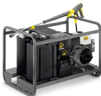
ケルヒャーが 2022 年に商標を取得した温水除草システム®