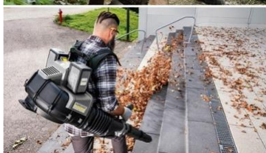
環境にやさしいながらも強力なパフォーマンスを誇るガーデンツール