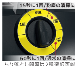
15秒に1回/粉塵の清掃に