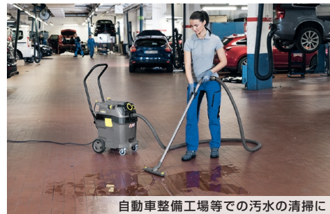
自動車整備工場等での汚水の清掃に