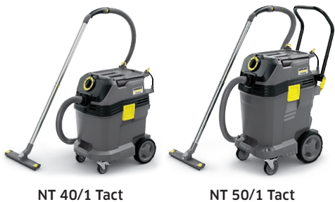
NT 40/1 Tact