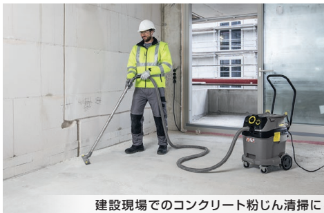
建設現場でのコンクリート粉じん清掃に