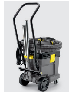
NT 40/1 Tact 専用ハンドル 注文番号: 2.643-868.0

標準装備 (帯電防止用のサクシオンホースとベンディングパイプへの交換で、帯電防止仕様に変更可能です)