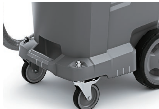
バンパー付きのボディで強度向上

ボディは強化プラスチック製で軽くて丈夫です。作業や移動がスムーズに行え、サビやへこみの心配もありません。