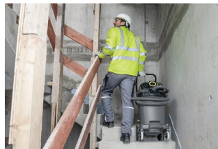
大型タイヤで階段移動もサポート