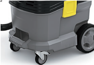
バンパー付きのボディで強度向上

ボディは強化プラスチック製で軽くて丈夫です。作業や移動がスムーズに行え、サビやへこみの心配もありません。