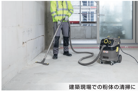
建築現場での粉体の清掃に