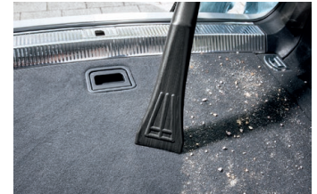
車用ノズル清掃イメージ