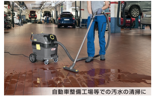
自動車整備工場等での汚水の清掃に