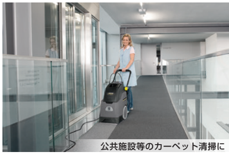
公共施設等のカーペット清掃に