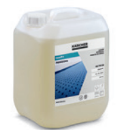
カーペット Pro ディープクリーナー RM 764 (10L)