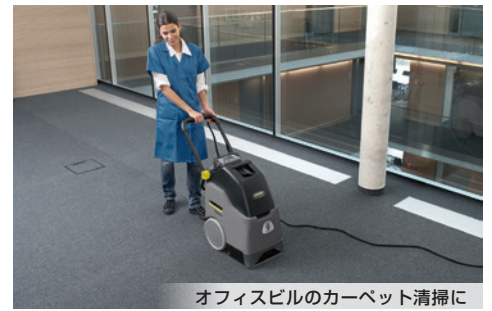
オフィスビルのカーペット清掃に