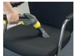
ハンドノズルでシミ取りも効果的