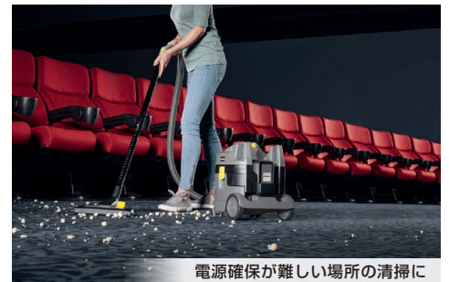
電源確保が難しい場所の清掃に