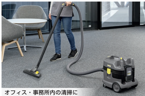
オフィス・事務所内の清掃に