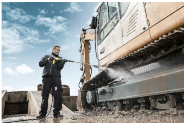
頑固な汚れも強力で洗浄する 高圧洗浄機 (HDS 1000 BE)