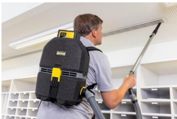
コードレス背負式クリーナー (BVL 5/1 BP)

※ニュースリリースに記載された内容は発表時の情報です。 予告なく変更する場合がありますので、ご了承ください。