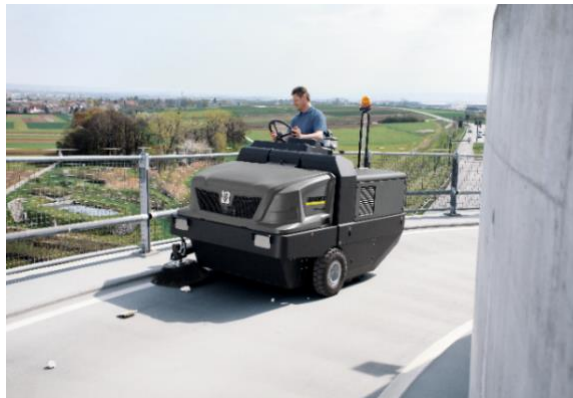
インダストリアルスイーパー (KIM 150/500 R D) で 広面積を短時間で効率的に清掃