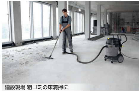
建設現場 粗ゴミの床清掃に