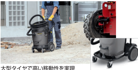
大型タイヤで高い移動性を実現

錆びない頑丈なプラスチックボディは耐久性に優れます。また、移動に便利な大型タイヤ付きで広い敷地内でも楽に移動できます。