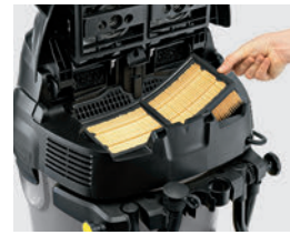
フィルターは洗って繰り返し利用可能