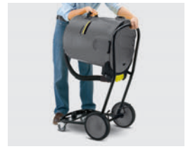
チルト式タンクで廃棄が簡単

ダストコンテナは65Lの大容量で、廃棄回数を減らし効率アップに貢献します。チルト式タンクで一人でも簡単にゴミを廃棄できます。