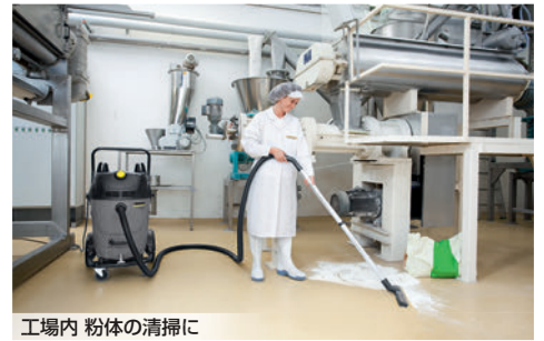
工場内 粉体の清掃に