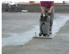
広範囲の清掃に(固定ノズル使用) (写真のクリーナーは本製品とは異なります)

様々な用途に対応するオプションアクセサリーをご用意しております。汚れの場所や状況に応じて、最適なアクセサリーをお選びいただけます。