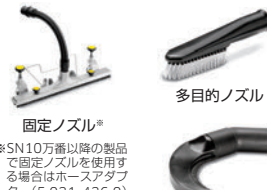
固定ノズル ※ ※SN10万番以降の製品で固定ノズルを使用する場合はホースアダプター(5,031-436.0)が必要です。