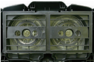
合計2,400W の高い吸引力で 清掃時間を短縮

1,200Wのパワフルモーターを2基搭載。フィルターは強化タイプを採用し、粉塵から切り子までさまざまなゴミの吸引が可能です。高い吸引力により作業時間が短縮できます。