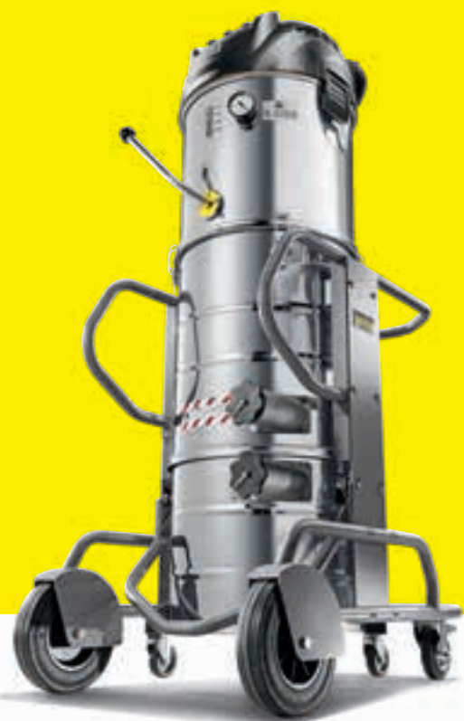
IVM 60/36-3 H

apparaten die betrouwbaar fijne olieachtige en vochtige media opzuigen, evenals grove media zoals gebroken noedels of verpakkingsresten. De vloeistofzuigers uit de IVR-klasse zijn perfect geschikt voor het opzuigen van alle vloeistoffen met de meest uiteenlopende bestanddelen die kenmerkend zijn voor de industrie.