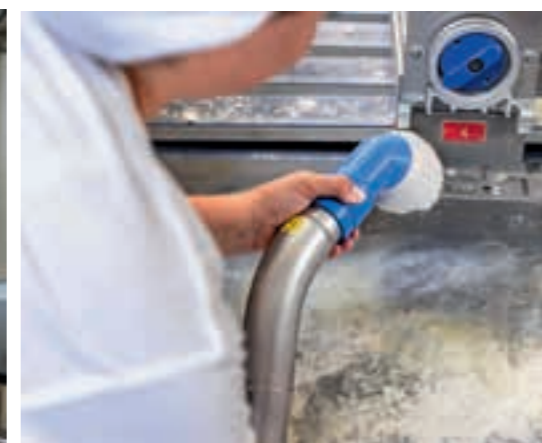
Linksboven: standaard mondstuk Linksonder: standaard mondstuk