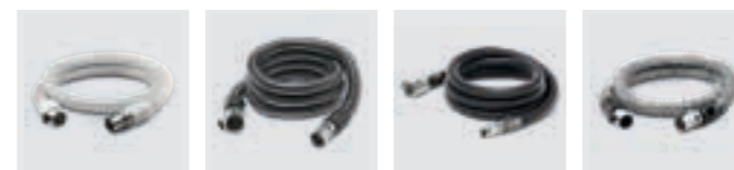
Slang PU opt. FDA-conform Slang PVC Slang EVA Slang Me hittebestendig