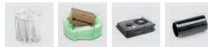
Filter Nomex hittebestendig Longpac afvoerszak composteerbaar Veiligheidsfilterzak Adapter food-grade