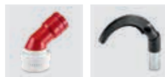
Ronde borstel Cilindrische borstel