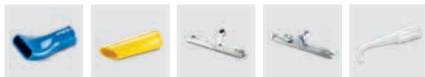
Oppervlaktezui- mond Standaard zuigmond Vloerzuigmond Vloerzuigmond hittebestendig Plintenzuigmond