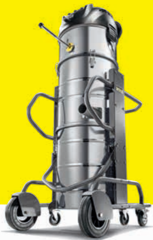
IVM 100/36-3 Oss

Middenklasse apparaten voor grote hoeveelheden stof met een goed doordachte overvulbeveiliging.