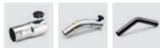
Handgreep RVS recht Handgreep RVS gebogen Handgreep carbon gebogen