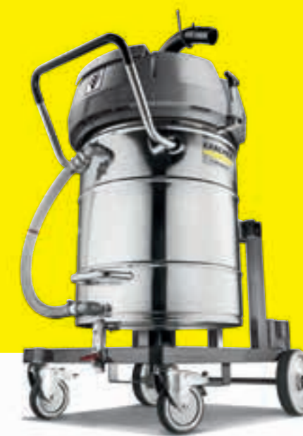
IVR-L 100/24-2 Tc Me