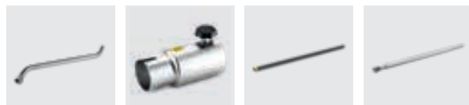
Zuigbuis RVS Reduceerstuk RVS Zuigbuis carbon Zuigbuis High Temperature