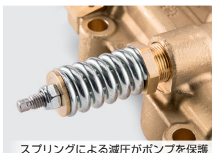
スプリングによる減圧がポンプを保護