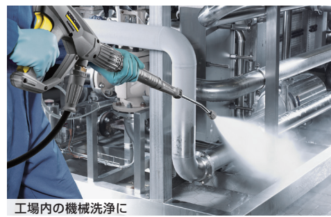
工場内の機械洗浄に