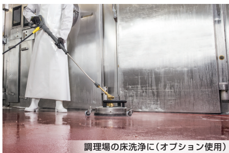
調理場の床洗浄に(オプション使用)