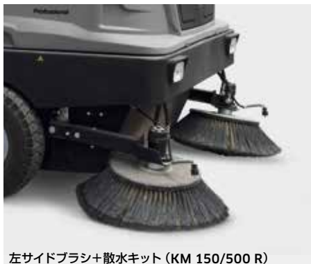
左サイドブラシ+散水キット (KM 150/500 R)