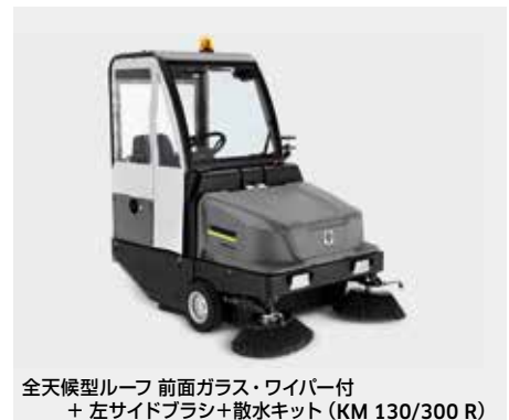
全天候型ルーフ 前面ガラス・ワイパー付 + 左サイドブラシ+散水キット (KM 130/300 R)