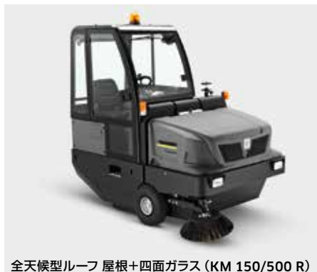
全天候型ルーフ 屋根+四面ガラス (KM 150/500 R)