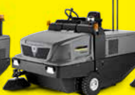
KM 150/500 R D Classic KM 150/500 R D