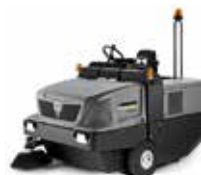
KM 150/500 R D Classic