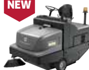
KM 105/180 R Bp Classic