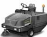
KM 130/300 R Bp (受注生産品)