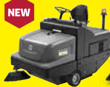
KM 105/180 R Bp Classic