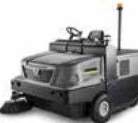
KM 170/600 R D Classic