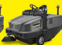
KM 120/250 R D Classic