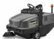
KM 120/250 R D Classic