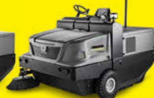
KM 170/600 R D Classic