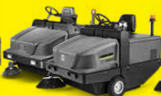
KM 130/300 R D Classic KM 130/300 R Bp KM 130/300 R D