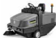
KM 130/300 R D (受注生産品)