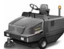
KM 130/300 R Bp (受注生産品)