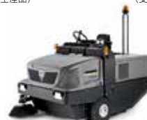
KM 150/500 R D