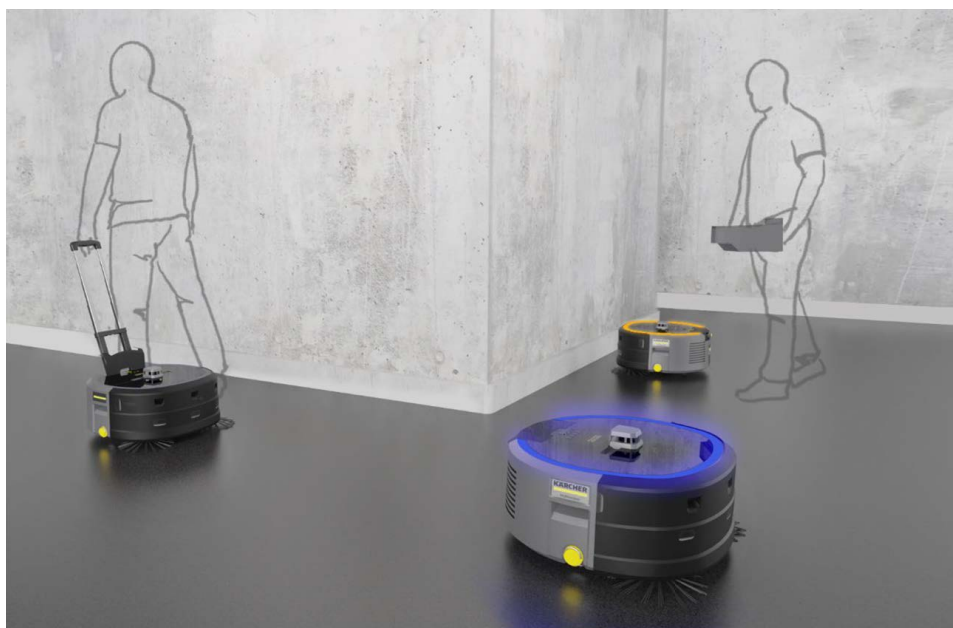
床清掃ロボット KIRA CV 50（参考出展）