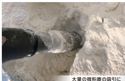
大量の微粉塵の吸引に