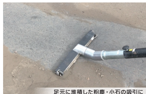
足元に堆積した粉塵・小石の吸引に