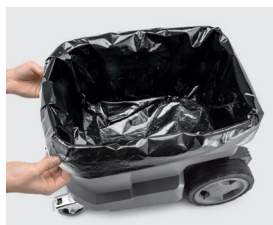
セーフティフィルターバッグ (実際の製品は白)

粉体再飛散を防止するセーフティフィルターバッグを1枚同梱しています。モーター保護フィルターが掃除機本体を保護します。本体シールキャップ付き。