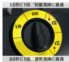
15秒に1回/粉塵清掃に最適