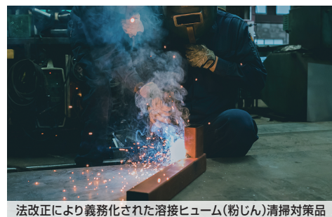
法改正により義務化された溶接ヒューム(粉じん)清掃対策品