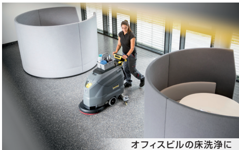
オフィスの床洗浄に