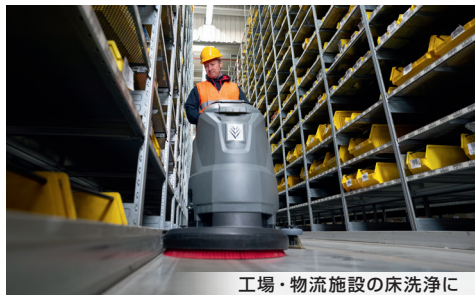
工場・物流施設の床洗浄に