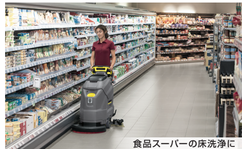
食品スーパーの床洗浄に