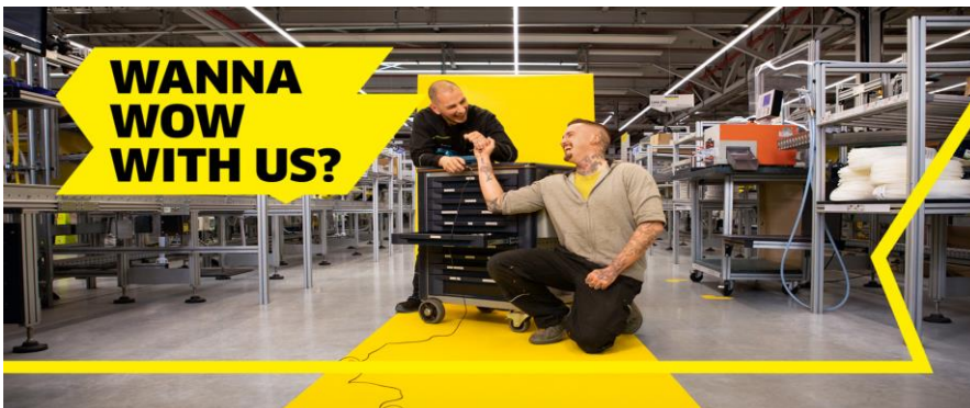
Een beeld uit de nieuwe werkgeverscampagne van Kärcher.