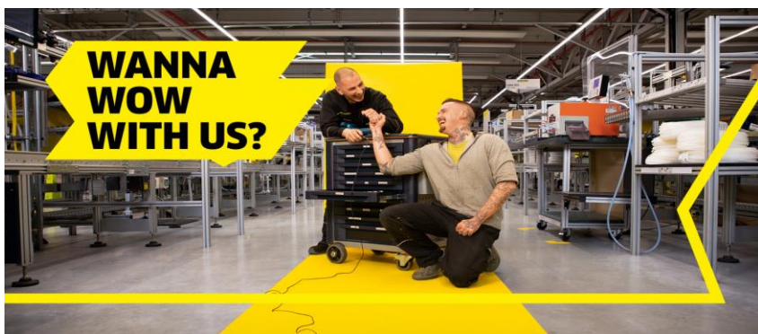
Un motif de la nouvelle campagne de recrutement de Kärcher.