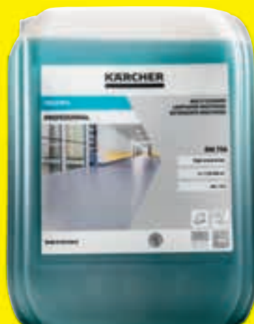
FloorPro multireiniger RM 756, 10 L Artnr. 6.295-914.0