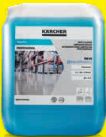
FloorPro basisreiniger RM 69, 10 L Artnr. 6.295-651.0

Kärcher FloorPro reinigingsmiddelen hebben een hoog rendement zodat u sneller en met minder kracht maximale reinigingsresultaten realiseert. Het FloorPro reinigingsmiddel is perfect op uw Kärcher schrob-/zuigmachine afgestemd. Dit betekent dat u uw werkzaamheden gemakkelijker, sneller en comfortabeler kunt uitvoeren. Tegelijkertijd profiteert u van de optimale bescherming die dit reinigingsmiddel biedt aan uw machine en de te reinigen oppervlakken.