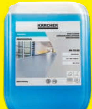
FloorPro Glansreiniger RM 755, 10 L Artnr. 6.295-174.0