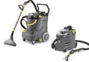
カーペットクリーナー