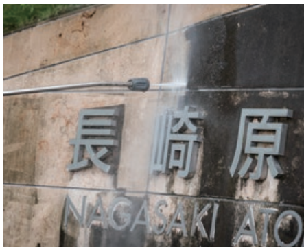
長崎県・長崎原爆資料館／2021年