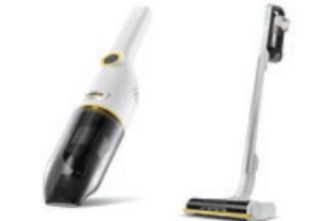
コードレスクリーナー