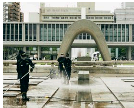
広島県・平和記念公園／2022年