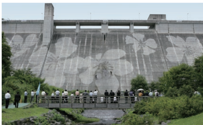
栃木県・松田川ダム／2008年