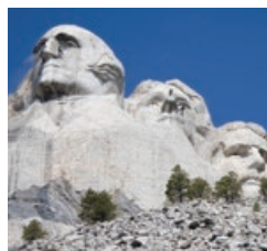
マウントラッシュモア (大統領巨大彫像)／2005年 サウスダコタ州 (アメリカ)