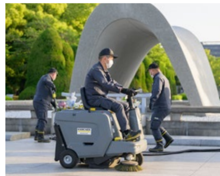
広島県・平和記念公園／2023年