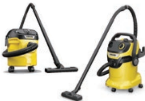
乾湿両用パキュームクリーナー