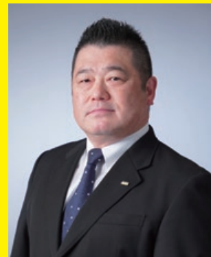
ケルヒャー ジャパン株式会社 代表取締役社長