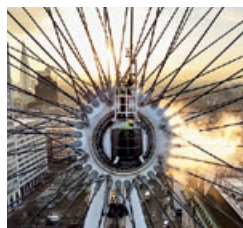
ロンドン・アイ／2013年 ロンドン (イギリス)