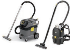
パキュームクリーナー