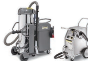
スペシャルビジネス