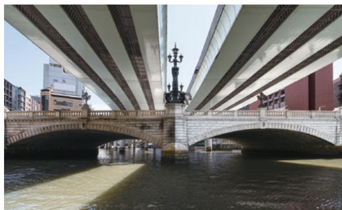
東京都・日本橋／2010年