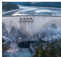
ラグラン湖ダム／2021年 ヴگران (フランス)