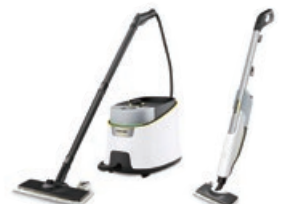
スチームクリーナー