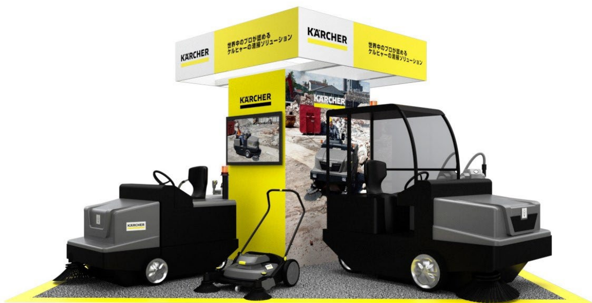
2024NEW 環境展 ケルヒヤーブースイメージ