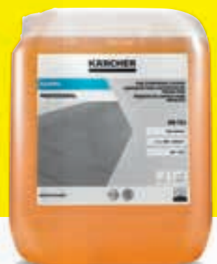
FloorPro reinigingsmiddel voor keramische tegels RM 753