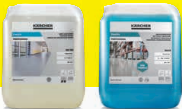
FloorPro onderhoudsreiniger Extra RM 780

In ruimtes met de hoogste vervuilingsgraad, zoals in industriële omgevingen of in de transportsector, verwijdert de industriële reiniger zelfs de meest hardnekkige vet-, olie-, roet- en mineraalvervuilingen krachtig en met weinig schuimvorming van alle watervaste, alkaligevoelige en -bestendige vloeren.