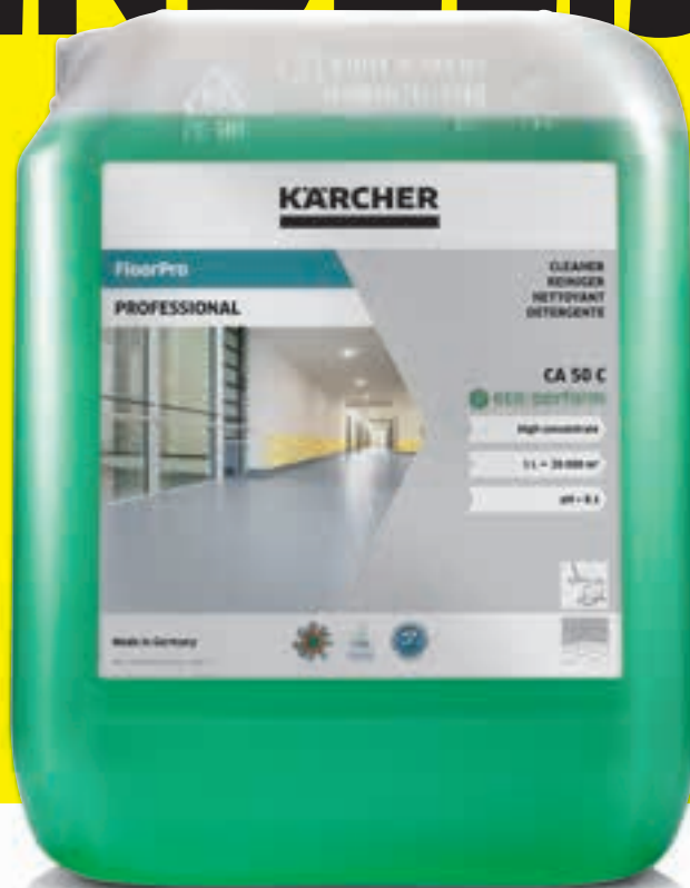
FloorPro reiniger CA 50 C eco!perform