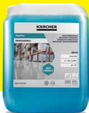
FloorPro Industrial Cleaner RM 69