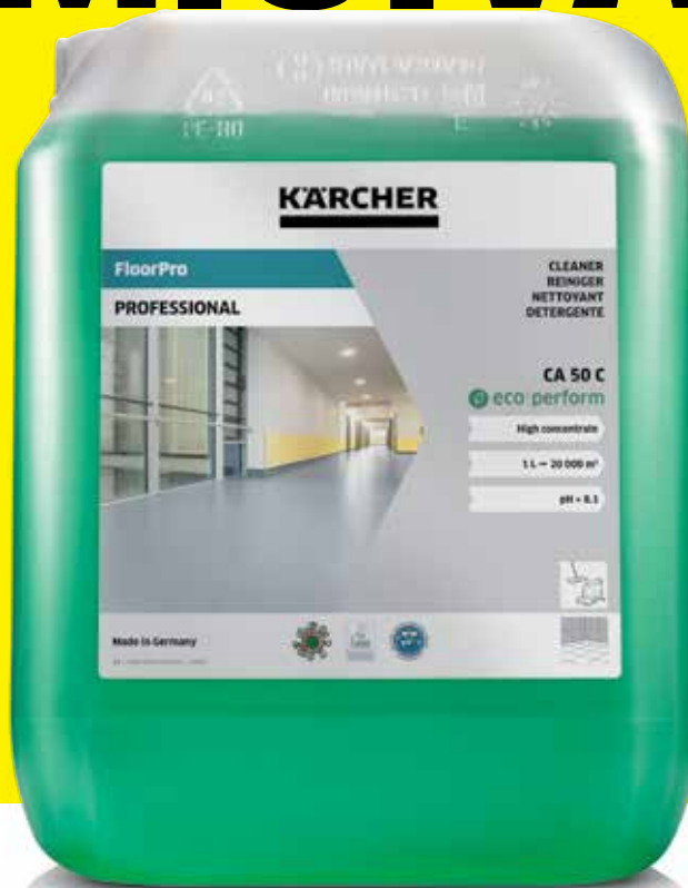
FloorPro Cleaner CA 50 C eco!perform