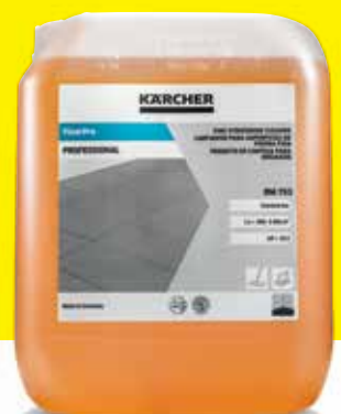
FloorPro Fine Stoneware Cleaner RM 753