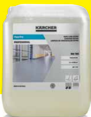
FloorPro Wipe Care Extra RM 780

Suunniteltu käytettäväksi korkean kontaminaatoriskin alueilla, kuten teollisuuskohteissa ja kuljetusalalla. Teollisuuspuhdistusaine, joka takaa tehokkaan ja vaahtoamattoman puhdistuksen jopa sitkeille rasva-, öljy-, noki- ja mineraalijäämille. Toimii erinomaisesti kaikilla vedenkestävillä, emäksille herkillä ja emäksiä kestäville latioilla.