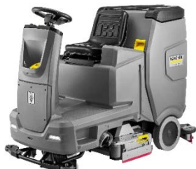
B 110 R Classic Bp +R75 (ローラーブラシタイプ)