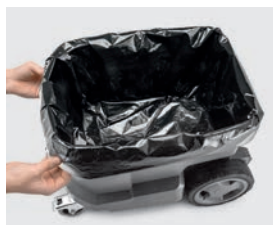
セーフティフィルターバッグ (実際の製品は白)

粉体再飛散を防止するセーフティフィルターバッグを1枚同梱しています。モーター保護フィルターが掃除機本体を保護します。本体シールキャップ付き。