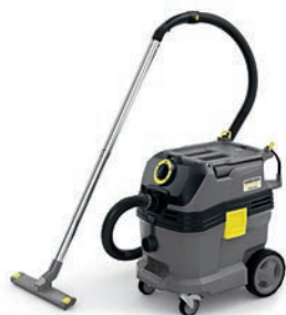
NT 30/1 Tact HEPA