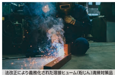
法改正により義務化された溶接ヒューム(粉じん)清掃対策品