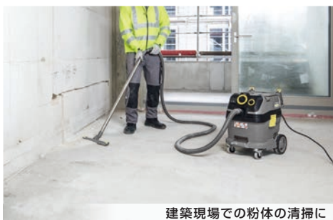
建築現場での粉体の清掃に