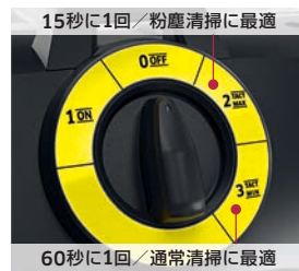
15秒に1回/粉塵清掃に最適