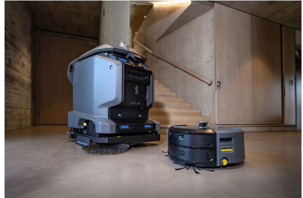
KIRA 自律型清掃ソリューション