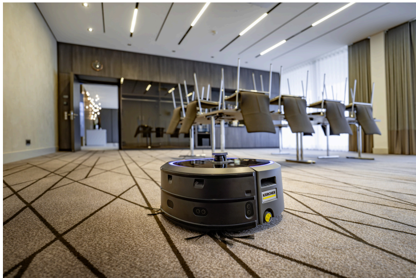
業務用ロボット掃除機「KIRA CV 50」

清掃機器の最大手メーカー、ドイツ・ケルヒャー社の日本法人、ケルヒャー ジャパン株式会社（本社:神奈川県横浜市港北区、代表取締役社長:大前勝己）は、業務用ロボット掃除機「KIRA CV 50」を10月1日(火)より発売開始いたします。