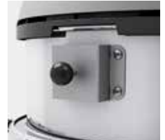
吸引力が低下した時のフィルターの塵落とし