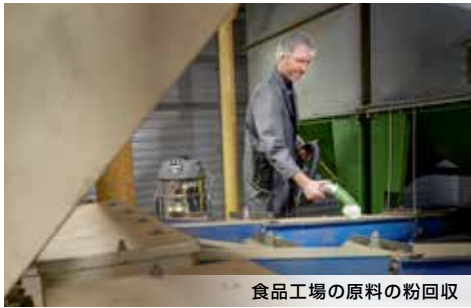
食品工場の原料の粉回収