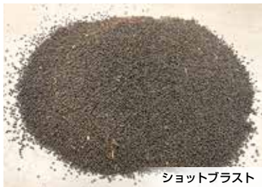
ショットブラスト

※IVM 40/24-2 は帯電防止仕様です。粉塵吸引時に発生する静電気を逃がします。