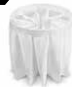
面積 1.6m 2 のフィルター

粉塵が付きにくい PTFE フィルター標準搭載。 フィルター面積は、1.6m 2