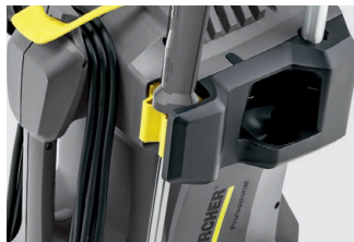
ランス固定ホルダー