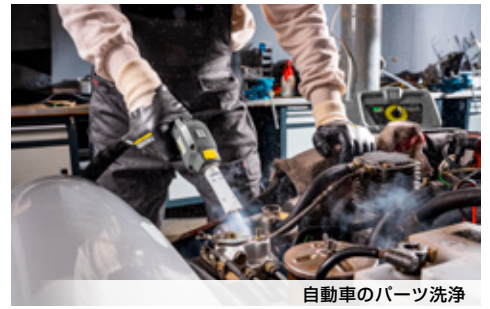
自動車のパーツ洗浄