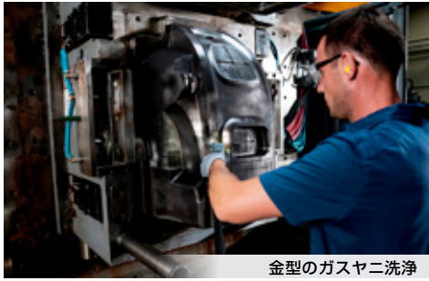
金型のガスヤニ洗浄