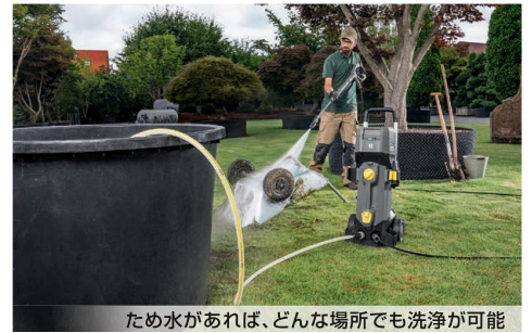
ため水があれば、どんな場所でも洗浄が可能