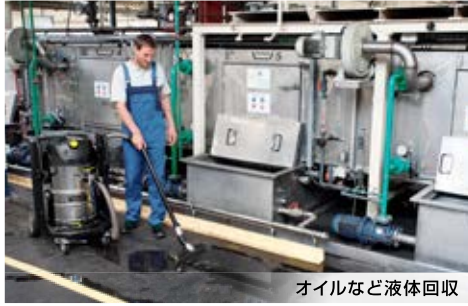
オイルなど液体回収