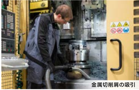
金属切削屑の吸引