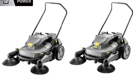
KM 70/25 C Bp 2SB KM 70/30 C Bp 2SB