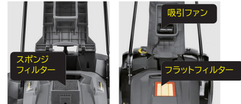
KM 70/25 C Bp

コンテナに掃き込まれた細かなチリやホコリは、吸引ファン(KM 70/30 C Bp 2SBのみ搭載)によってフィルターに取り込まれます。飛散を防ぎ、周りの空気を汚しません。