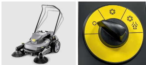
レバー一つで簡単面圧調整。

メインブラシがバッテリー駆動なので歩行スピードに関わらず均一な清掃効果が得られ、軽く押すだけで清掃が行えます。使用者の身長に合わせて調整が可能で、操作パネルはダイヤルをイラストに合わせるだけの簡単操作です。