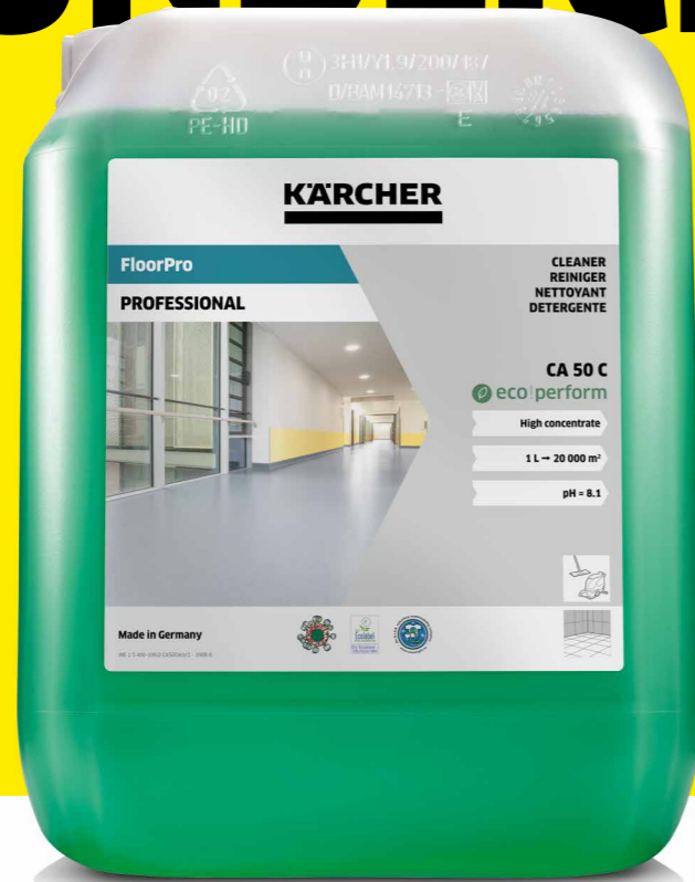
FloorPro Reiniger CA 50 C eco!perform