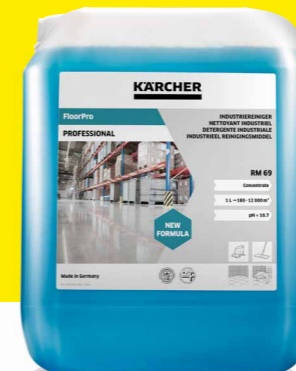
FloorPro Industriereiniger RM 69

In Abhängigkeit vom Verschmutzungsgrad, dem Einsatzort und dem jeweiligen Bodenbelag empfiehlt Kärcher unterschiedliche Reinigungsmittel zum Einsatz mit dem Reinigungsroboter KIRA B 50 – jeweils natürlich perfekt auf das Gerät abgestimmt, sicher in der Anwendung und umweltfreundlich im Einsatz.