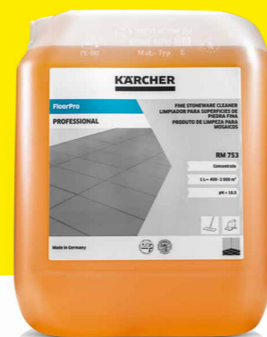
FloorPro Feinsteinzeugreiniger RM 753