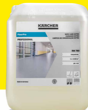
FloorPro Wischpflege Extra RM 780