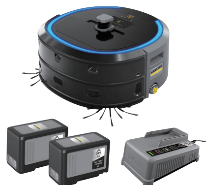
ロボット掃除機 KIRA CV 50 + バッテリー （2個）+ 充電器（1個）