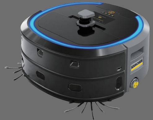
業務用ロボット掃除機