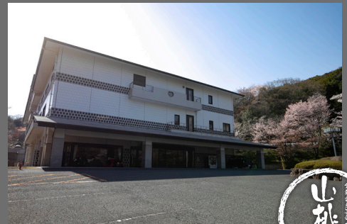
倉敷由加温泉ホテル 山桃花