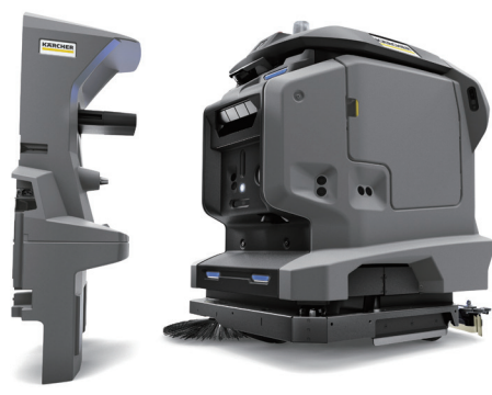
床洗浄ロボット KIRA B 50 + KIRA ドッキング ステーション（各1台）