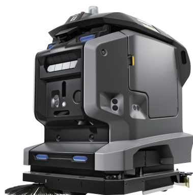
床洗浄ロボット KIRA B 50 本体