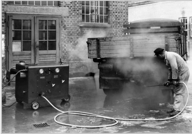
Het eerste reinigingsapparaat van Kärcher: de eerste Europese KW 350 warmwater hogedrukreiniger uit 1950.