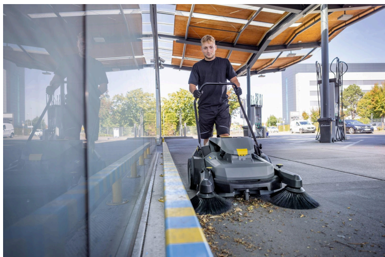
手押し式スーパー「KM 70/30 C Bp 2SB」

※ニュースリリースに記載された内容は発表時の情報です。 予告なく変更する場合がありますので、ご了承ください。