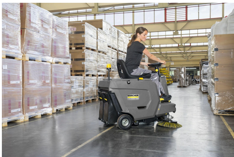
搭乗式スqueeパー「KM 85/50 R Bp」