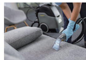
ハンドノズルでシミ取りも効率的