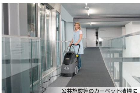
公共施設等のカーペット清掃に