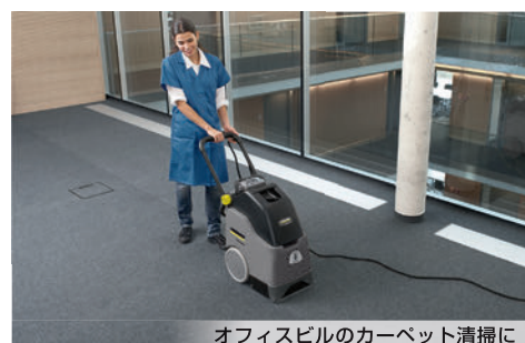
オフィスビルのカーペット清掃に