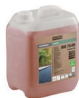
カーペット Pro カーペット洗浄機用洗浄剤 RM 764N(5L/10L)