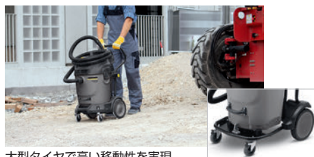
大型タイヤで高い移動性を実現

錆びない頑丈なプラスチックボディは耐久性に優れます。また、移動に便利な大型タイヤ付きで広い敷地内でも楽に移動できます。