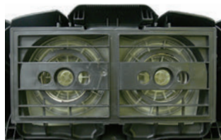
合計2,400W の高い吸引力で 清掃時間を短縮

1,200Wのパワフルモーターを2基搭載。フィルターは強化タイプを採用し、粉塵から切り子までさまざまなゴミの吸引が可能です。高い吸引力により作業時間が短縮できます。