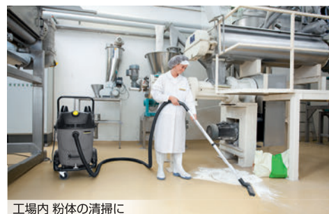
工場内 粉体の清掃に