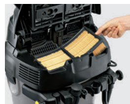
フィルターは洗って繰り返し利用可能