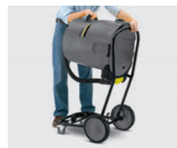
チルト式タンクで廃棄が簡単

ダストコンテナは65Lの大容量で、廃棄回数を減らし効率アップに貢献します。チルト式タンクで一人でも簡単にゴミを廃棄できます。