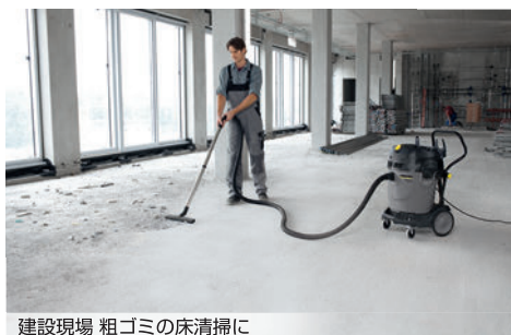
建設現場 粗ゴミの床清掃に