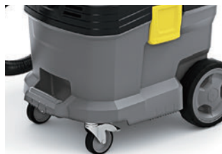
バンパー付きのボディで強度向上

ボディは強化プラスチック製で軽くて丈夫です。作業や移動がスムーズに行え、サビやへこみの心配もありません。