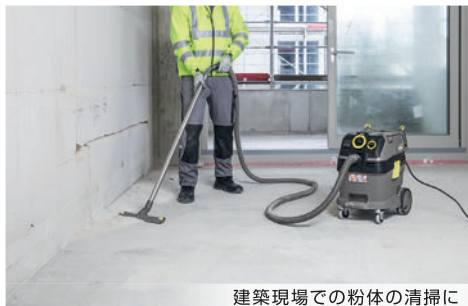
建築現場での粉体の清掃に