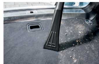
車用ノズル清掃イメージ