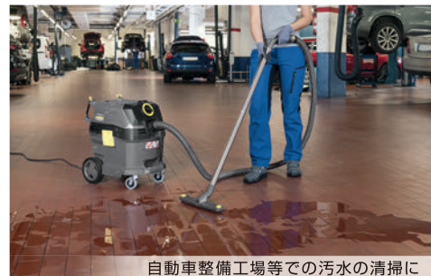
自動車整備工場等での汚水の清掃に