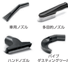
車用ノズル 多目的ノズル ハンドノズル バイブダスティングツール

オプションアクセサリはバラエティ豊か。清掃する場所や汚れに応じて最適なアクセサリをお選びいただけます。