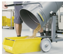
簡単 チルト式タンク