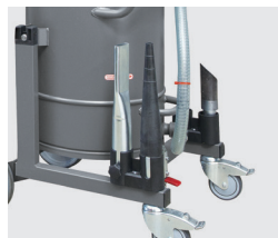
アクセサリホルダー