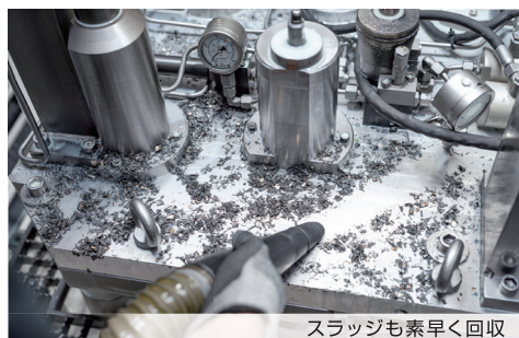
スラッジも素早く回収