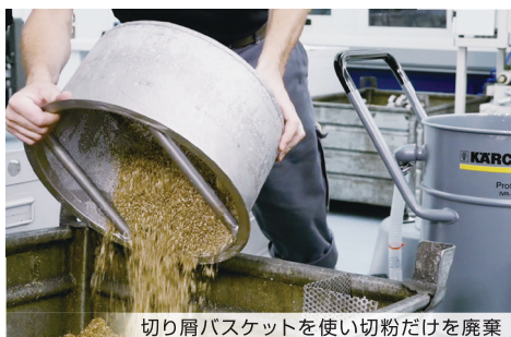
切り屑バスケットを使い切粉だけを廃棄