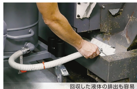
回収した液体の排出も容易