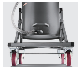
廃棄の労力を軽減