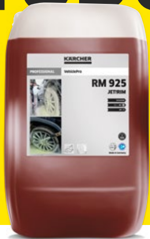
VehiclePro Jet!Rim RM 925