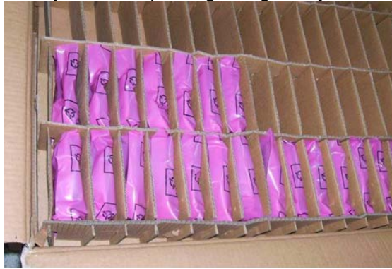
Example: Series packing with grid trays