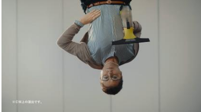
天井から窓用バキュームクリーナーを 持った女性が登場