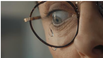
作業中にメガネを伝って汗が 落ちそうに