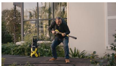
地面の床も忘れずに清掃