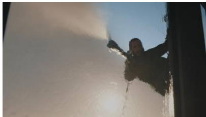
汚れている窓を清掃