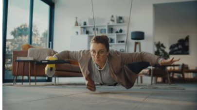
床につかないように 降りてくる