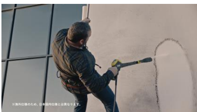
外壁の土汚れも撃退