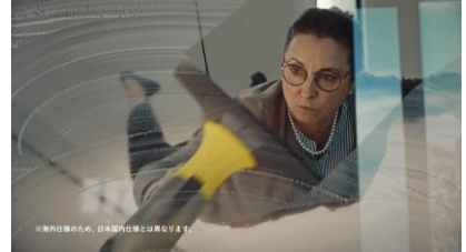
窓用バキュームクリーナーを使って 窓掃除