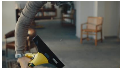
落ちる前に 窓用バキュームクリーナーで吸引