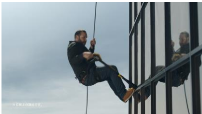
ビルの屋上から高圧洗浄機を 持った男性が登場