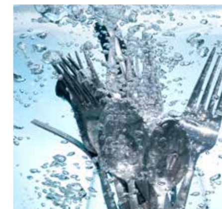
Kärcher glänzt nun auch in der Küche – selbst bei großen Besteck- und Geschirrmengen.