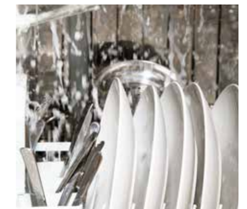
Alles sauber – unabhängig von Maschinentyp, Wasserqualität oder Verschmutzungsgrad.