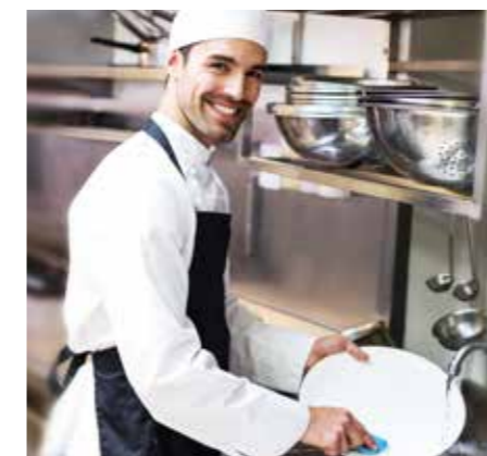
Strahlend sauberes Geschirr? Unsere neuen Handspülmittel machen's möglich.

Profis wissen: Nur wo Kärcher draufsteht, steckt auch die volle Kärcher Reinigungspower drin. Das KitchenPro Küchenhygiene Sortiment eignet sich hervorragend für die Gastronomie und Hotellerie sowie für alle Betriebe mit einer Großküche – wie Schulen, Altersheime, Krankenhäuser, Firmen und viele mehr.