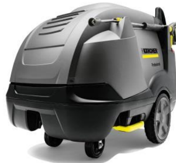
【温水モデル】HDS 10/19 M 吐出圧力3-19MPa