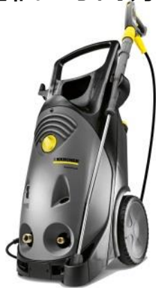
【冷水モデル】HD 10/22 S 吐出圧力3-22MPa