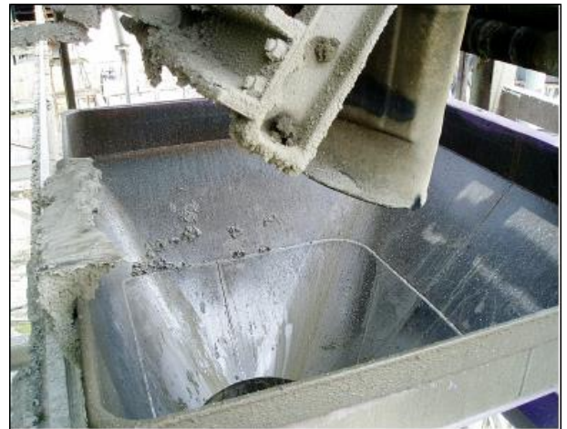
ホッパー、パッチャープラント固着セメント剥離に