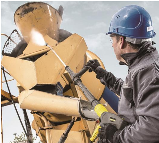
ミキサー車の洗浄に