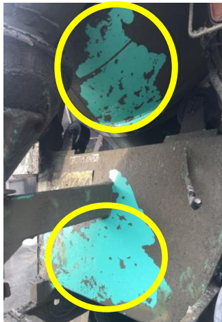
ミキサー車洗浄例 ※黄色枠は洗浄後 (豊富なオプション品)