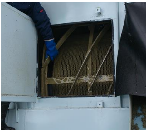
トロンメル選別機の内部のふり洗い洗浄に