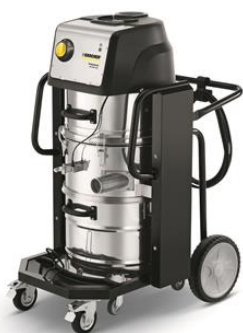
IVC 60/30 Tact

生コンの乾いた粉塵も 自動フィルタチリ落とし機能 で、フィルタの目詰まりを防止し、連続運転を可能にします。