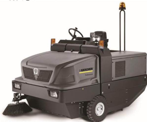
写真はKM 150/500 RD