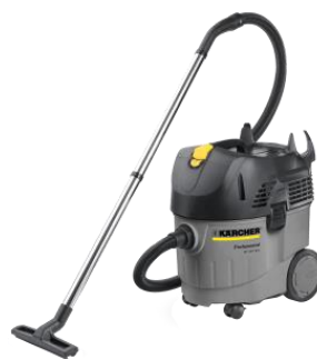
NT 35/1 Tact