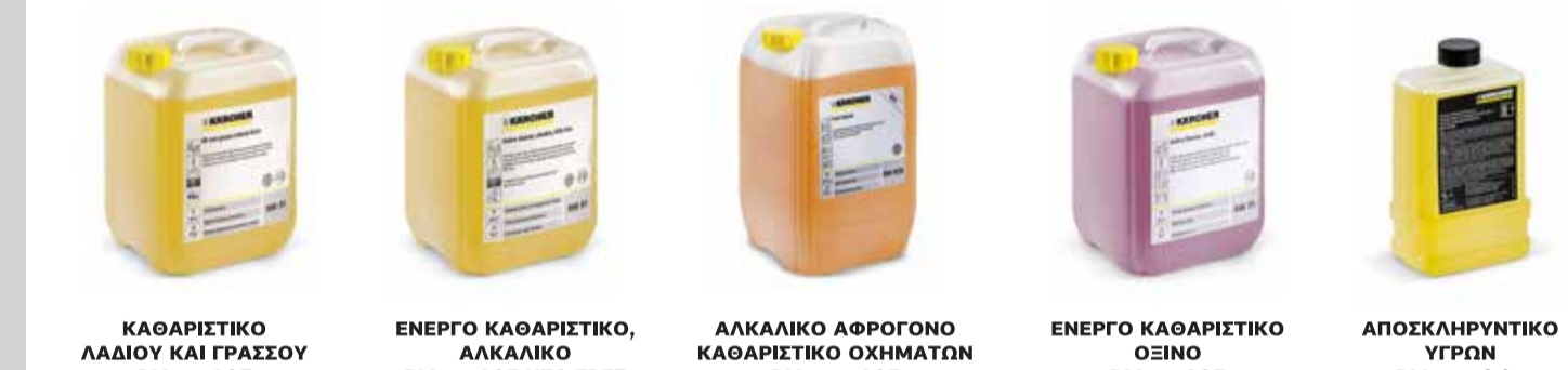
ΚΑΘΑΡΙΣΤΙΚΟ ΛΑΔΙΟΥ ΚΑΙ ΓΡΑΣΣΟΥ RM 31 ASF ΕΝΕΡΓΟ ΚΑΘΑΡΙΣΤΙΚΟ, ΛΑΚΚΑΛΙΚΟ RM 61 ASF NTA FREE ΔΑΚΔΙΚΟ ΑΡΡΩΓΟΝΟ ΚΑΘΑΡΙΣΤΙΚΟ ΟΧΗΜΑΤΩΝ RM 85B ASF ΕΝΕΡΓΟ ΚΑΘΑΡΙΣΤΙΚΟ ΟΞΙΝΟ RM 25 ASF ΑΠΟΣΚΛΗΡΥΚΤΙΚΟ ΥΓΡΩΝ RM 110 Adv