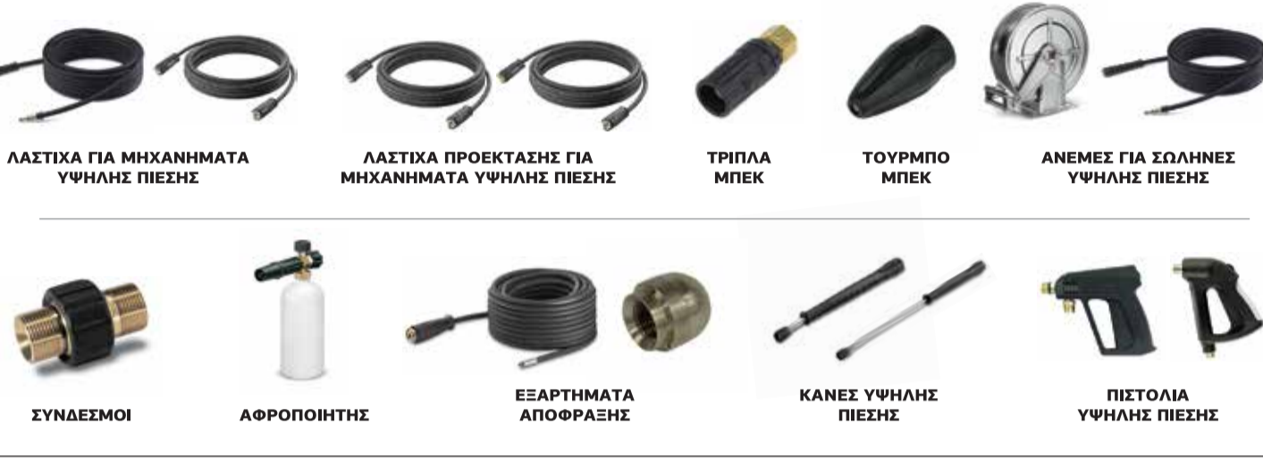
ΛΑΣΤΙΚΑ ΓΙΑ ΜΗΧΑΝΗΜΑΤΑ ΥΨΗΛΗΣ ΠΙΕΣΗΣ ΛΑΣΤΙΚΑ ΠΡΟΕΚΤΑΣΗΣ ΓΙΑ ΜΗΧΑΝΗΜΑΤΑ ΥΨΗΛΗΣ ΠΙΕΣΗΣ ΤΡΙΠΛΟ ΜΠΕΚ ΤΟΥΡΜΠΟ ΜΠΕΚ ΑΝΕΜΕΣ ΓΙΑ ΣΙΔΗΡΕΣ ΥΨΗΛΗΣ ΠΙΕΣΗΣ ΣΥΝΔΕΣΜΟΙ ΑΦΟΡΠΟΙΗΤΗΣ ΕΞΑΡΤΗΜΑΤΑ ΑΠΟΦΡΑΞΗΣ ΚΑΝΕΣ ΥΨΗΛΗΣ ΠΙΕΣΗΣ ΠΙΣΤΟΛΙΑ ΥΨΗΛΗΣ ΠΙΕΣΗΣ