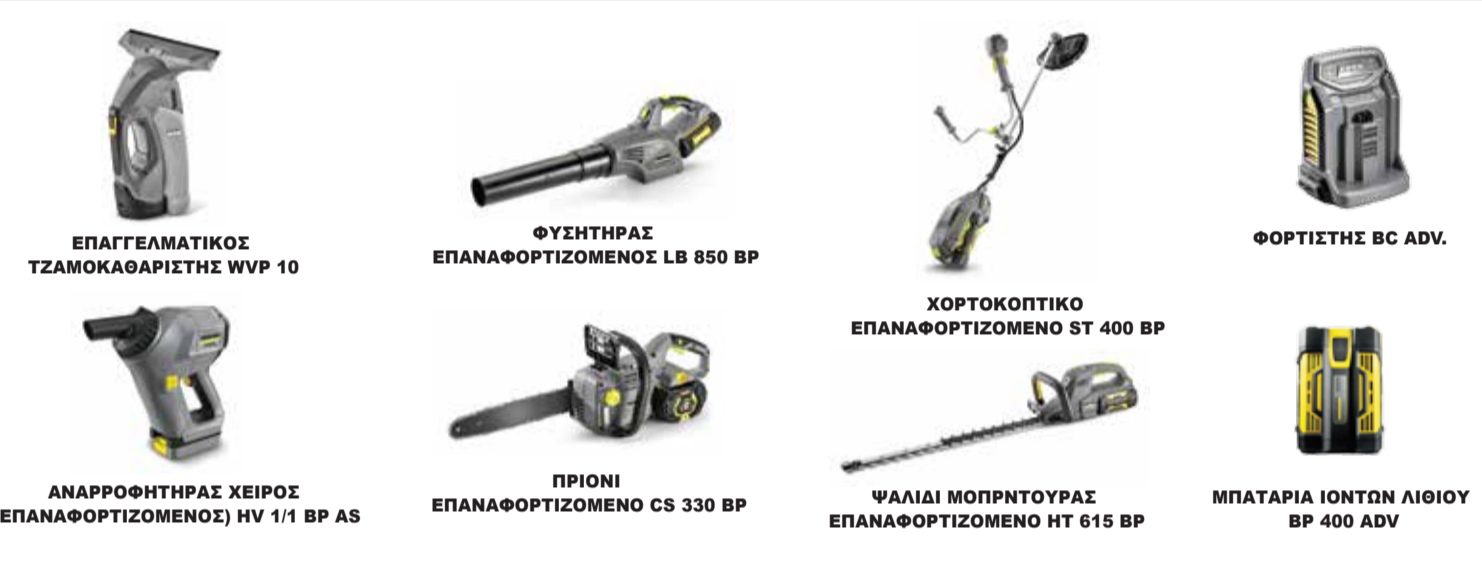
ΕΠΑΓΓΕΛΜΑΤΙΚΟΣ ΤΣΑΜΟΚΑΒΑΡΙΣΤΗΣ WVP 10 ΦΥΣΤΗΡΑΣ ΕΠΑΝΑΦΟΡΤΙΖΟΜΕΝΟΣ LB 850 BP ΦΟΡΤΙΣΤΗΣ BC ADV. ΧΟΡΤΟΚΟΠΤΙΚΟ ΕΠΑΝΑΦΟΡΤΙΖΟΜΕΝΟ ST 400 BP ΦΑΛΔΙ ΜΟΝΤΡΟΥΣΑ ΕΠΑΝΑΦΟΡΤΙΖΟΜΕΝΟ HT 615 BP ΑΝΑΡΡΟΦΗΤΗΡΑΣ ΧΕΙΡΟΣ (ΕΠΑΝΑΦΟΡΤΙΖΟΜΕΝΟΣ) HV 1/1 BP AS ΠΙΣΤΙΝ ΕΠΑΝΑΦΟΡΤΙΖΟΜΕΝΟ CS 330 BP ΜΠΑΤΑΡΙΑ ΙΟΝΤΩΝ ΛΙΘΙΟΥ BP 400 ADV