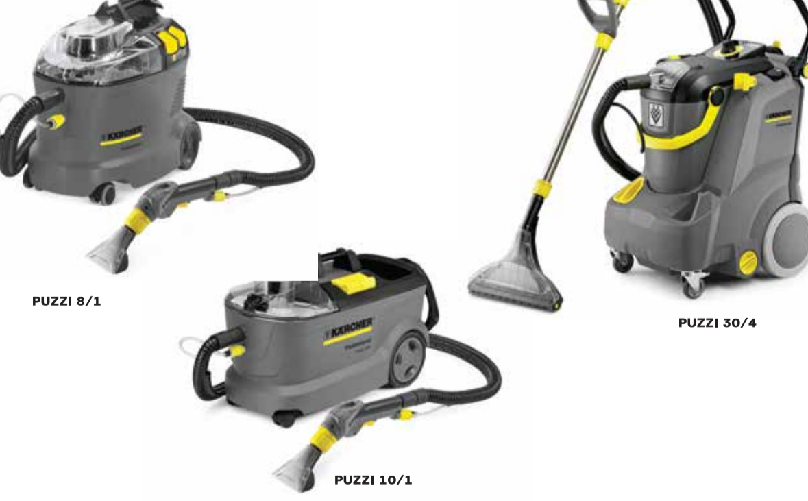
PUZZI 8/1 PUZZI 30/4 PUZZI 10/1