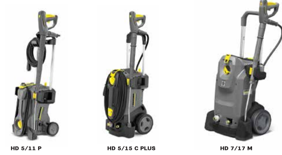
HD 5/11 P HD 5/15 C PLUS HD 7/17 M