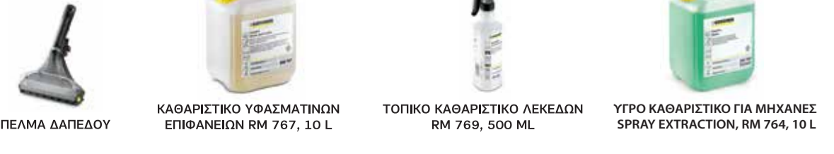
ΠΕΛΑΜΑ ΔΑΠΕΔΟΥ ΚΑΘΑΡΙΣΤΙΚΟ ΥΦΑΣΜΑΤΙΝΩΝ ΕΠΙΦΑΝΕΙΩΝ RM 767, 10 L ΤΟΠΙΚΟ ΚΑΘΑΡΙΣΤΙΚΟ ΛΕΚΕΔΩΝ RM 789, 500 ML ΥΓΡΟ ΚΑΘΑΡΙΣΤΙΚΟ ΓΙΑ ΜΗΧΑΝΕΣ SPRAY EXTRACTION, RM 764, 10 L