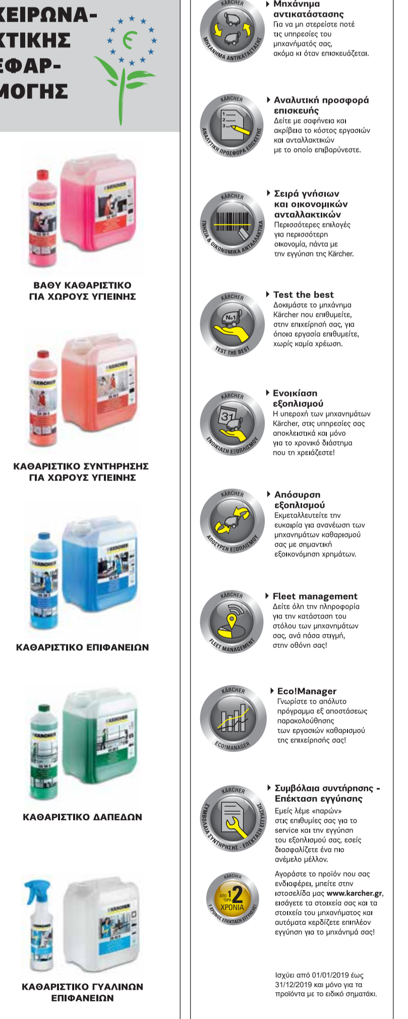
ΒΑΘΥ ΚΑΘΑΡΙΣΤΙΚΟ ΓΙΑ ΧΩΡΟΥΣ ΥΓΙΕΙΝΗΣ ΚΑΘΑΡΙΣΤΙΚΟ ΣΥΝΤΗΡΗΣΗΣ ΓΙΑ ΧΩΡΟΥΣ ΥΓΙΕΙΝΗΣ ΚΑΘΑΡΙΣΤΙΚΟ ΕΠΙΦΑΝΕΙΩΝ ΚΑΘΑΡΙΣΤΙΚΟ ΔΑΠΕΔΩΝ ΚΑΘΑΡΙΣΤΙΚΟ ΓΥΑΛΙΝΩΝ ΕΠΙΦΑΝΕΙΩΝ