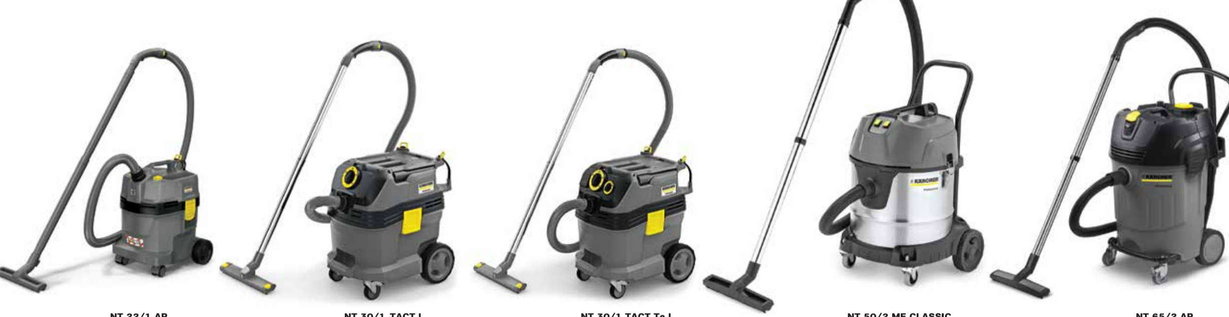
NT 22/1 AP NT 30/1 TACT L NT 30/1 TACT T6 L NT 50/2 ME CLASSIC NT 65/2 AP