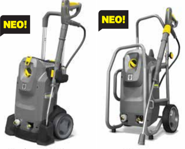
HD 6/16-4 M PLUS HD 8/18-4 M

ΚΑΙΝΟΤΟΜΑ ΧΗΜΙΚΑ ΚΑΘΑΡΙΣΤΙΚΑ ΓΙΑ ΑΚΟΜΑ ΚΑΛΥΤΕΡΑ ΑΠΟΤΕΛΕΣΜΑΤΑ