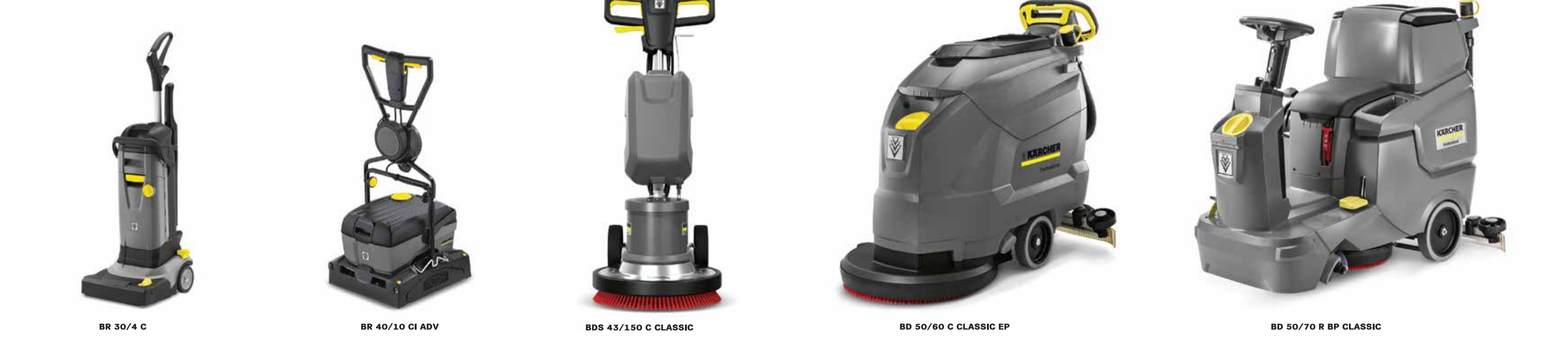
BR 30/4 C BR 40/10 CI ADV BDS 43/150 C CLASSIC BD 50/70 R BP CLASSIC