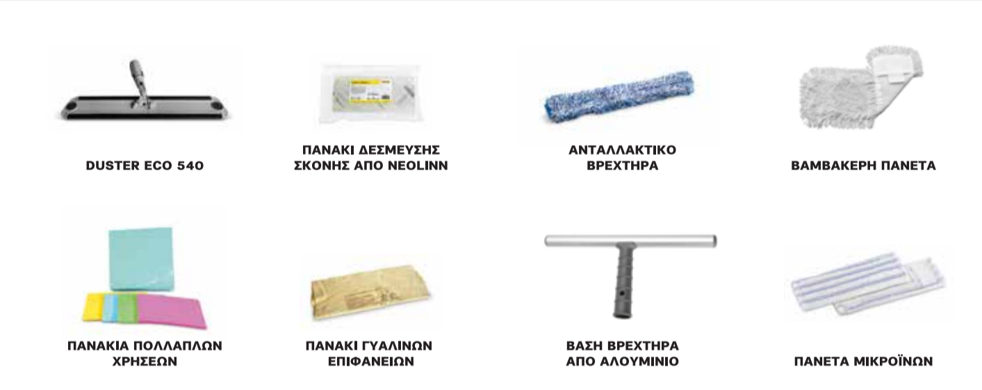
DUSTER ECO 540 ΠΑΝΑΚΙ ΔΕΣΜΕΥΣΗΣ ΣΚΟΝΗΣ ΑΠΟ ΝΕΟΛΙΝΝ ΑΝΤΑΛΛΑΚΤΙΚΟ ΒΡΕΧΤΗΡΑ ΒΑΜΒΑΚΕΡΗ ΠΑΝΕΤΑ ΠΑΝΑΚΙΑ ΠΟΛΥΑΛΑΝΗ ΧΡΗΣΕΩΝ ΠΑΝΑΚΙ ΓΥΑΛΙΝΩΝ ΕΠΙΦΑΝΕΙΩΝ ΒΑΖΗ ΒΡΕΧΤΗΡΑ ΑΠΟ ΑΛΟΥΜΙΝΙΟ ΠΑΝΕΤΑ ΜΙΚΡΩΣΙΩΝ