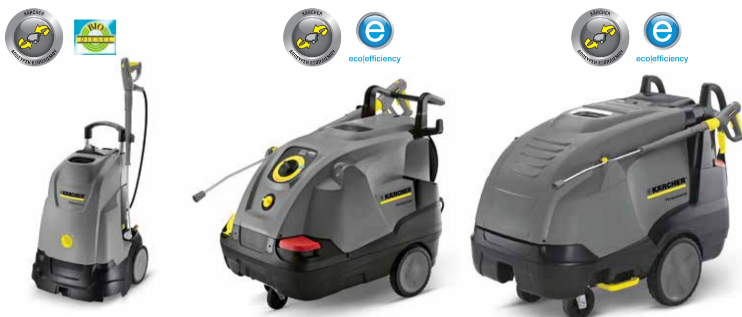
HDS 5/15 U (ΟΡΘΙΟΥ ΤΥΠΟΥ) HDS 8/18-4 C HDS 10/20-4 M