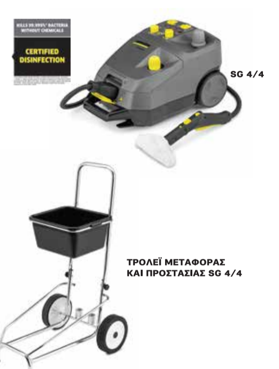
SO 4/4 TROJEE METAΦΟΡΑΣ ΚΑΙ ΠΡΟΣΤΑΣΙΑΣ SO 4/4