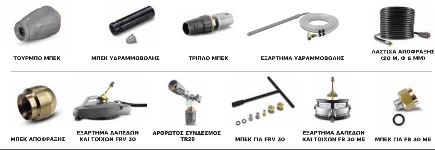
ΤΟΥΡΜΠΟ ΜΠΕΚ ΜΠΕΚ ΥΔΡΑΜΜΟΒΟΛΗΣ ΤΡΙΠΛΟ ΜΠΕΚ ΕΞΑΡΤΗΜΑ ΥΔΡΑΜΜΟΒΟΛΗΣ ΛΑΣΤΙΚΑ ΑΠΟΦΡΑΞΗΣ (20 Μ, Φ 6 ΜΜ) ΜΠΕΚ ΑΠΟΦΡΑΞΗΣ ΕΞΑΡΤΗΜΑ ΔΑΠΕΔΩΝ ΚΑΙ ΤΟΙΧΩΝ FRV 30 ΑΡΩΡΤΟΣ ΣΥΝΔΕΣΜΟΣ TR20 ΜΠΕΚ ΓΙΑ FRV 30 ΕΞΑΡΤΗΜΑ ΔΑΠΕΔΩΝ ΚΑΙ ΤΟΙΧΩΝ FR 30 ΜΕ ΜΠΕΚ ΓΙΑ FR 30 ΜΕ