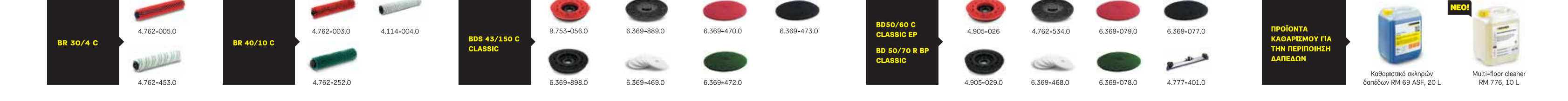
BR 30/4 C 4.762-005.0 4.762-453.0 BR 40/10 C 4.762-003.0 4.114-004.0 4.762-252.0 BDS 43/150 C CLASSIC 9.753-056.0 6.369-889.0 6.369-470.0 6.369-473.0 6.369-888.0 6.369-469.0 6.369-472.0 BD 50/70 R BP CLASSIC 4.905-028 4.762-334.0 6.369-079.0 6.369-077.0 4.905-029.0 6.369-468.0 6.369-078.0 4.777-401.0